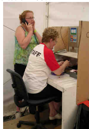
Dur dur la gestion des jetons aux Eurockéennes