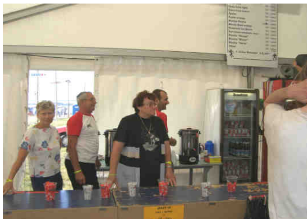
Le café est prêt

Dernièrement restauré, un des deux confessionnal situé à gauche en entrant dans l'église, a dû être démonté. Cet ensemble patrimonial atteint par le mэрule (champignon du bois), sera remis en état prochainement par l'entreprise Besançon de Belfort. Les travaux de restauration de la croix monolithe située aux abords de la RD 465 ainsi que la remise en place de la croix dite du choléra (appelé ainsi par nos anciens villageois) qui était situé au nord du terrain d'aviation, sont reportés en 2007.